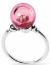
Bolla di Romanticismo Argento 925/ Vetro Designer: Lone Løvschal