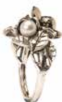
Biancospino con Perla Argento 925/ Perla Designer: Søren Nielsen

I ricordi mi battono dentro come un secondo cuore. 214 EUR