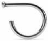
Anello del Cambiamento Argento 925 Designer: Kim Buck