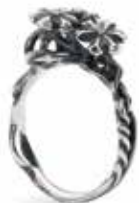
Anello TAGRI-00301/310 Luce di Stella Argento 925/ Diamanti 0.06 ct. Misure: Designer: 11-20 Kristian Krysfeldt

Dedicato a tutti quegli istanti memorabili che vorremmo durassero in eterno. 214 EUR