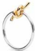
Ricordati di Me Argento 925/ Oro 18 kt. Designer: Mette Saabye

Le cose più semplici sono sempre quelle più eleganti... Come questa delicata margherita. 195 EUR