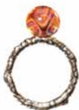
L'occhio di Afrodite Argento 925/ Vetro Designer: Lise Aagaard

Un fiore di perla grigia, nato dalle acque, simbolo essenziale della femminilità creatrice. 83 EUR