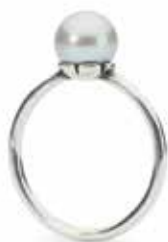
Anello Petali di Perla Grigia Argento 925/ Perla Designer: Lise Aagaard

La perla è essenza di purezza che resta invariata nel tempo. 83 EUR