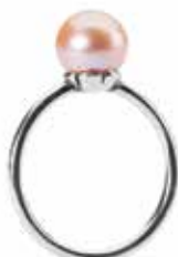
Anello TAGRI-00321/30 Petali di Perla Rosa Argento 925/ Perla Misure: Designer: 11-20 Lise Aagaard

Non posso vincere senza di te, mia regina. 56 EUR