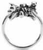
Anello TAGRI-00271/280 Bacche di Mirtillo Argento 925 Misure: Designer: 11-20 Lars Søgaard

Il mirtillo dona la vitalità e la persistenza per vincere le sfide e conquistare ogni traguardo! 69 EUR