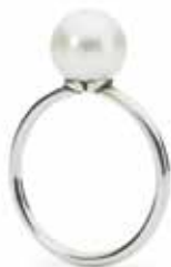
Anello Petali di Perla Bianca Argento 925/ Perla Designer: Lise Aagaard

Un delicato biancospino nasconde una perla preziosa... 83 EUR