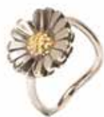
Margherita Argento 925/ Oro 18 kt. Designer: Søren Nielsen