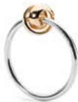
Anello TAGRI-00291/300 Eternità, oro Argento 925/ Oro 18 kt Misure: Designer: 11-20 Kim Buck

Dedicato a tutti quegli istanti memorabili che vorremmo durassero in eterno. 69 EUR