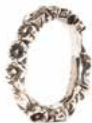
Soffio Argento 925 Designer: Søren Nielsen