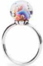
Anello Aurora Argento 925/ Vetro Designer: Lise Aagaard