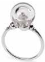
Bolla di Magia Argento 925/ Vetro Designer: Lone Løvschal