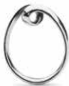
Anello Eternità TAGRI-00261/270 Argento 925 Misure: Designer: 11-20 Kim Buck

Guarda oltre i limiti ed impara a volare. 69 EUR