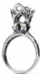
Anello TAGRI-00311/320 Regina di Cuori Argento 925 Misure: Designer: 11-20 Louise Rimpler

Chi ha la luce in viso, un giorno sarà stella! 125 EUR