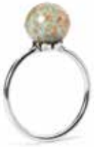
Anello Meditazione Argento 925/ Vetro Designer: Lise Aagaard